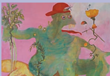
Lise Lotte Helm

20.-31. juli: Birgitte Sandvik , malerier/bronzeskulpturer