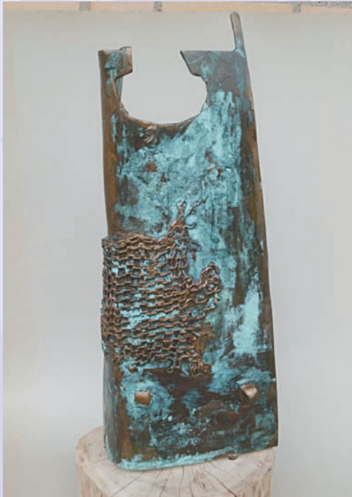
Joseph Salamon Bronzeskulptur