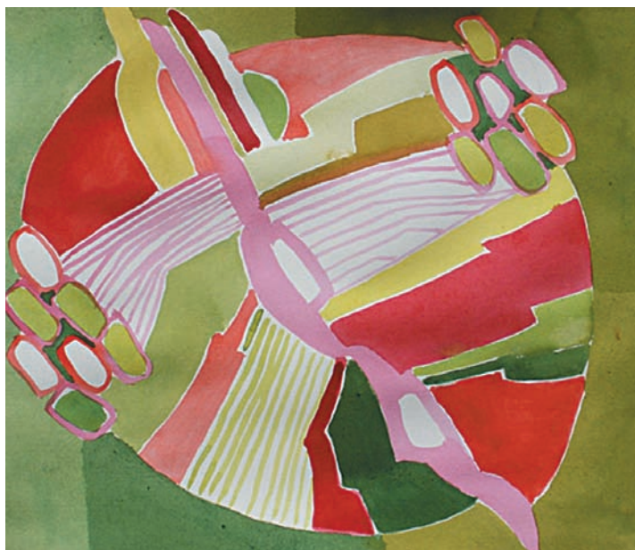
Hanne Sie Valmuefugl

Udstillingsperiode: 3.-24. september 2011