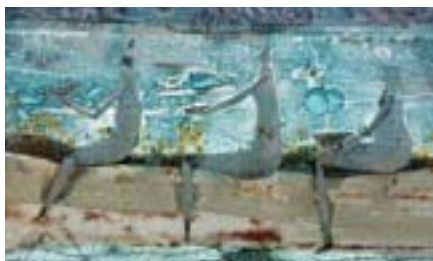
Eksempel på Branka Lugonjas glaskunst

Pris: kr. 325 pr. person. Betaling (og dermed tilmelding) via netbank inden 5. maj på konto 1551-1033220. HUSK at anføre navn(e) og "Sommerudflugt".