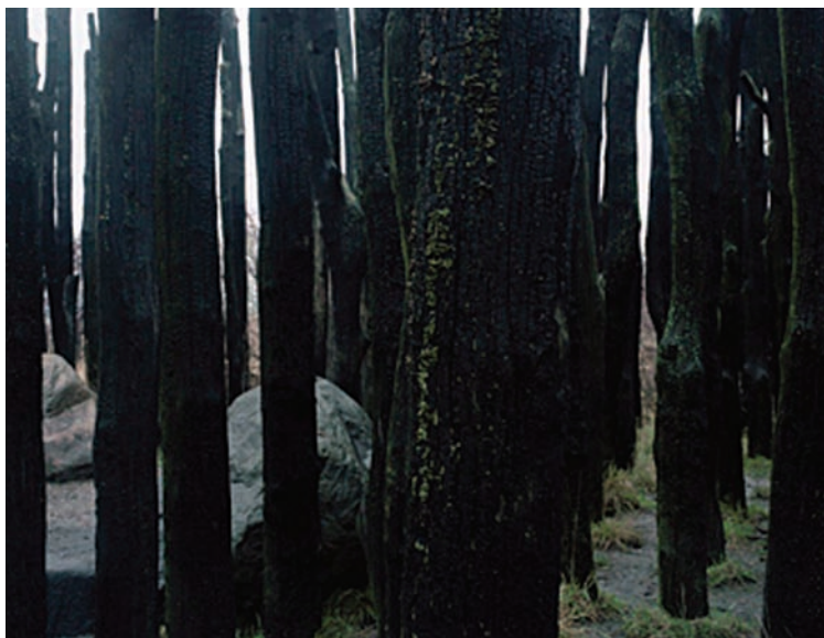
Jørn Zoega Olesen

Tre billedkunstnere, der alle arbejder med det landskabelige rum, undersøger, genskaber og forarbejder steder afgrænset af mennesket: "Territorier"