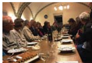
Så var der serveret!

huset oppe og nede, ude og inde og fik undervejs kyndig oplysning fyldt med anekdoter. Alle klarede strabadserne med trappe op, trappe ned, og vi sluttede af i personalets kantine med vin og rådhuspandekager.