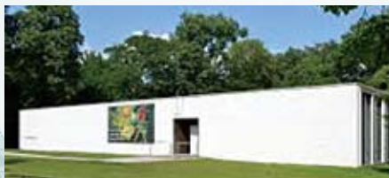
Ernst Barlach Haus

seer. Der er også et besøg i det fine lille Ernst Barlach Haus, der rummer klassisk, moderne og